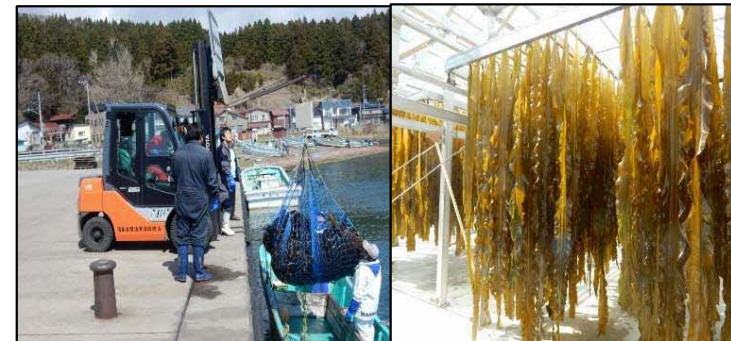
コンブは生のまま出荷